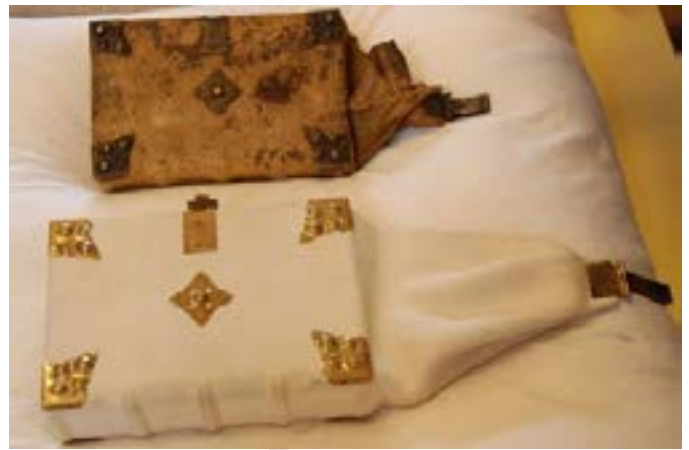
Boven: Gebetbuch, Neurenberg, Drukker van de Rochus legende, ca 1484