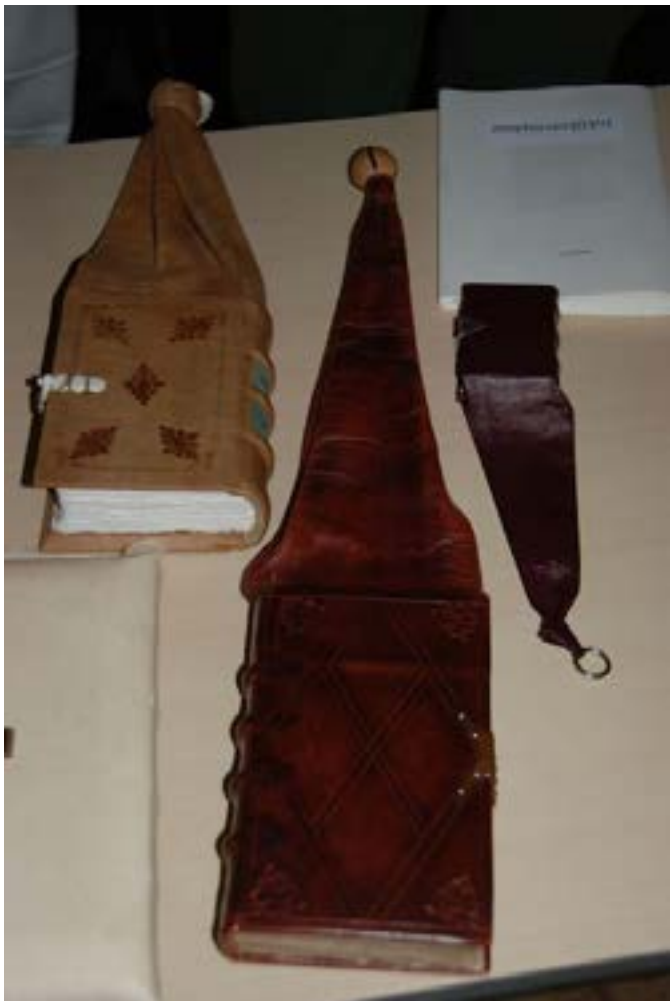
Drie buidelboeken met in het midden het boek met de knop.